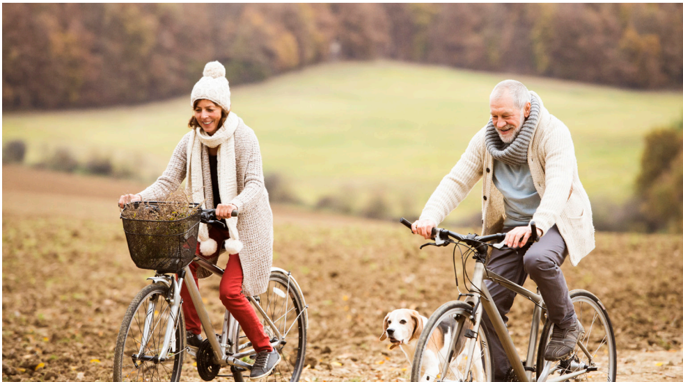
Servicewohnen im idyllischen Regental - Johann Feldbauer Bau GmbH

Auch die Firma Feldbauer hat bei der Gemeinde Walderbach ein Grundstück zur Errichtung von 38 Servicewohnungen mit Tagespflege im Wege des Erbbaurechts erworben, da das Erbbaurecht einige Vorteile bietet.