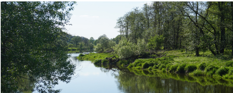
Servicewohnen im idyllischen Regental - Johann Feldbauer Bau GmbH

Die Regentalhänge zwischen Kirchenrohrbach und Zenzing sind ein Naturschutzgebiet bei Walderbach und Roding im Oberpfälzer Landkreis Cham in Bayern. Die Weiträumigkeit der naturnahen Flusslandschaft sowie die historische Nutzung der Hänge als Niederwald prägen die Schönheit der Landschaft.